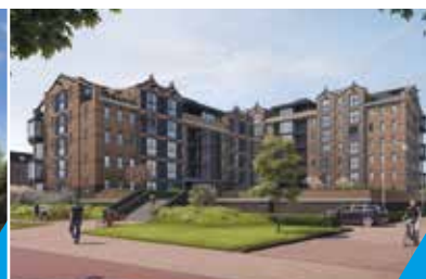
KOP VAN RHIJN OESTGEEST