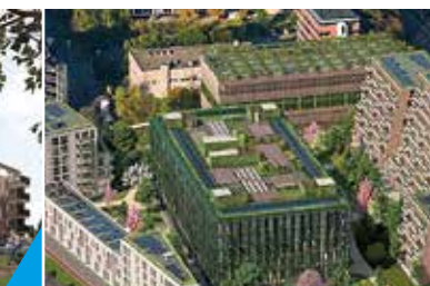
TRANSITIE 96 APPARTEMENTEN HILLEGOM