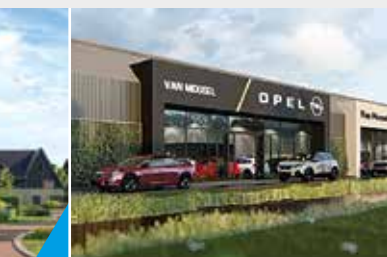
SHOWROOM EN GARAGE MIDDELHARNIS