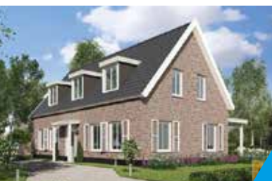
LUXE VILLA OOSTVOORNE

"Schipper was indertijd m'n tweede stageplaats. Over en weer beviel dat goed en zo begon ik hier als leerling monteur. Na het behalen van niveau 2 ging ik verder voor niveau 3. Ja, da's best pittig met die avondlessen naast je werk. Inmiddels ben ik leidinggevend monteur en heb binnenkort een 'eigen werk' onder handen. Ik vind het aantrekkelijk mijn kennis en ervaring te delen met jonge mensen. En voor mij gaat er niets boven 'buiten' werken, samen met alle andere disciplines op de bouw iets maken waar we samen trots op zijn."