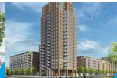
HAGA LEIJENBURG DEN HAAG