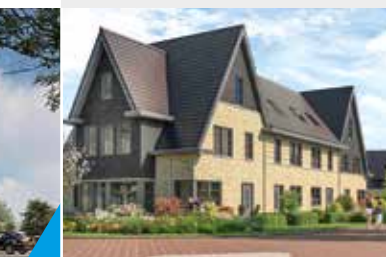
BUITENPLAATS RIJNWEIDE OESTGEEST