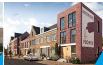
WONINGEN DIRKZWAGER SCHIEDAM