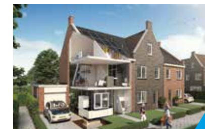
INNOVATIEHUIS STAD AAN HET HARINGVLIET